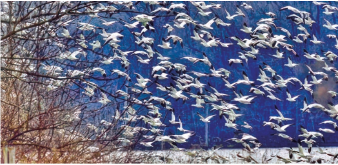
Los gansos de nieve a la Área de Dirección de la Fauna Silvestre de Arroyo Medio (Middle Creek), condado de Lancaster.

humedales. La migración anual de los gansos de nieve aquí son un momento cumbre para los observadores de aves.