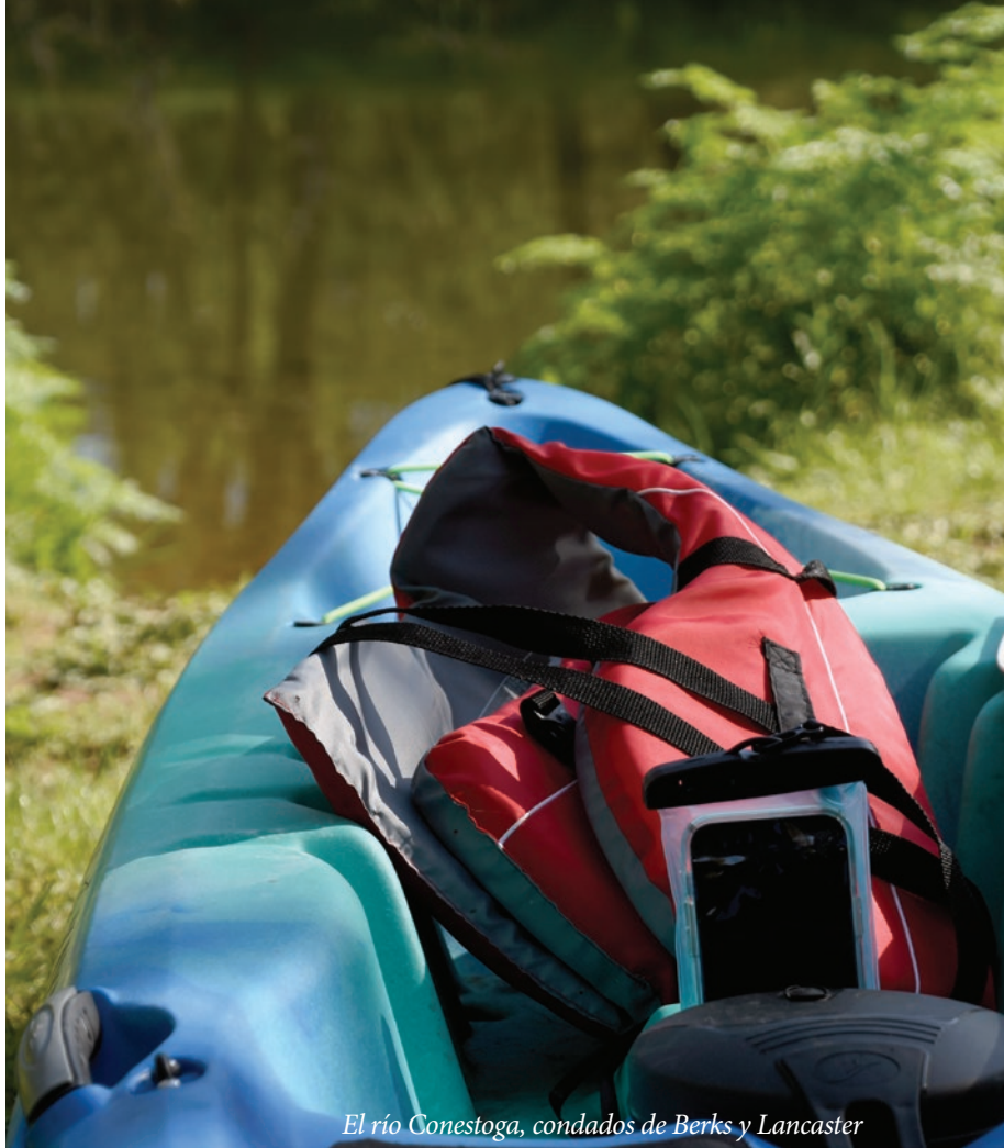
El río Conestoga, condados de Berks y Lancaster