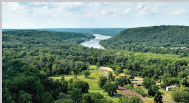
El río Delaware de Bowman's Hill Tower, condado de Bucks