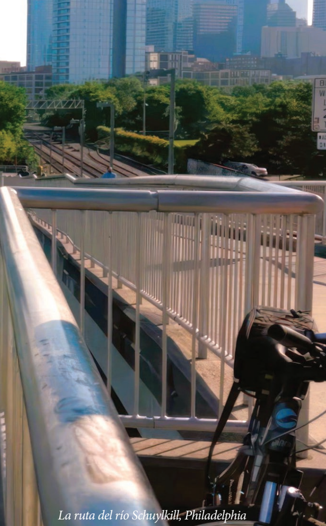
La ruta del río Schuylkill, Philadelphia