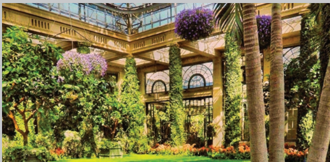
Longwood Jardines, condado de Chester