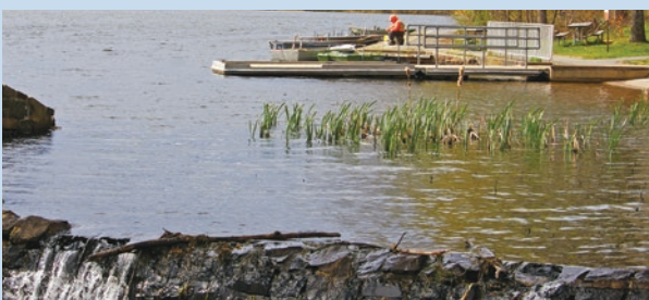
Parque Estatal de Arroyo Francés, condados de Berks y Chester

Las designaciones regionales son basadas en las regiones de Comisión de Pescar y Pasear en el Barco de Pennsylvania.