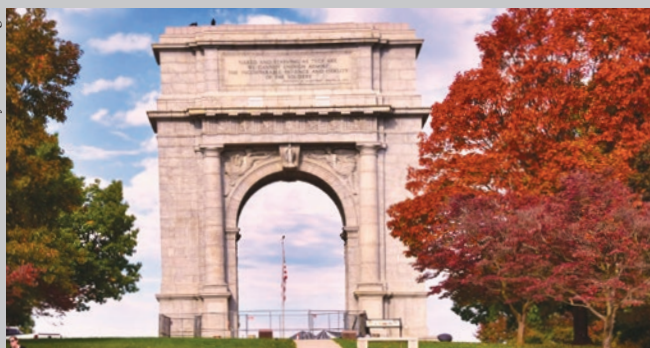
Parque Nacional Histórico de Valley Forge, condados de Montgomery y Chester