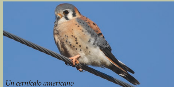
Un cernícalo americano