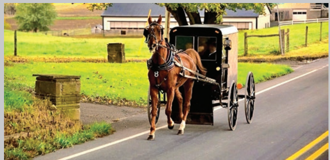
Un caballo y carta por la carretera, condado de Lancaster